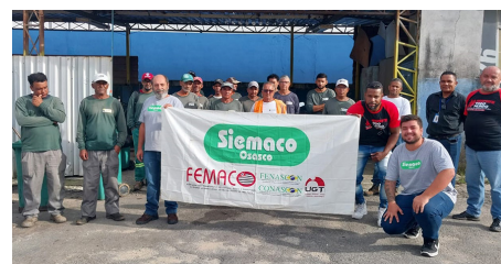
Categoria aprovou a pauta de reivindicações nas assembleias com o Siemaco Osasco